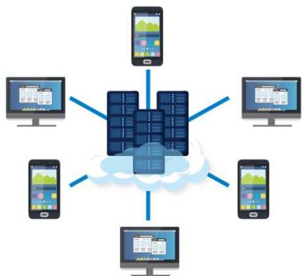
中央集権型システム (従来システム)