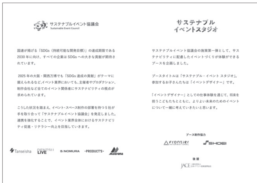
図4 サステナブルイベント協議会の趣旨を訴求

通常の業務と同様、クライアントである広告主からのオリエンをきっかけに作業がスタート。