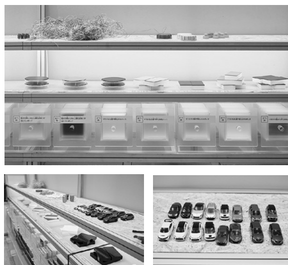
図 3 ブース模型を作るための素材たち