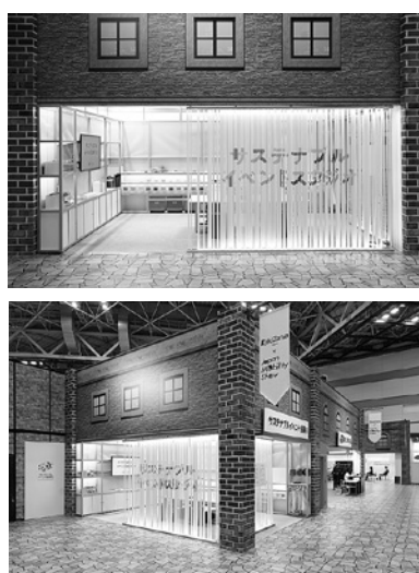
図 2 サステナブルイベント協議会ブース（外観）